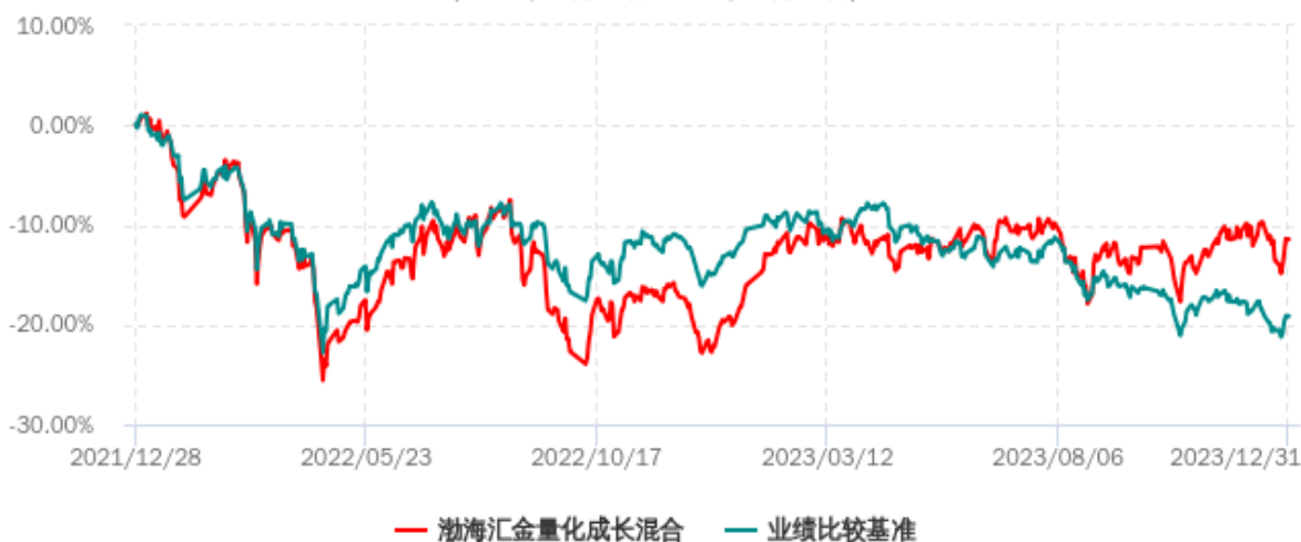
渤海汇金量化成长混合型发起式证券投资基金累计净值增长率与业绩比较基准收益率历史走势对比图 (2021年12月28日-2023年12月31日)